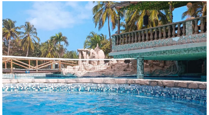
Piscina al aire libre