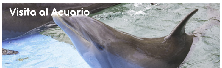
Visita al Acuario